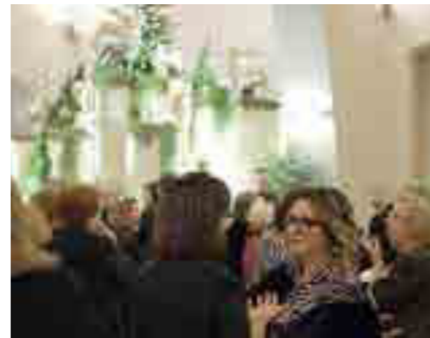
Festa degli Auguri