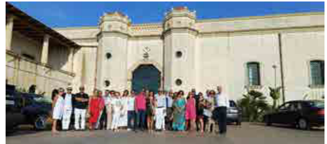
Cantina Fina - RC Marsala e RC Palermo Nord, alla scoperta di un'eccellenza vinicola