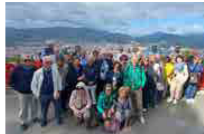
Bilbao, Spagna del Nord - Il Rotary Club di Marsala in visita