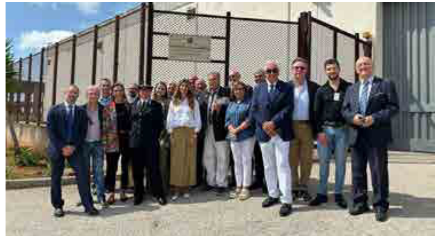
Presidenti dell'Area Drepanum e le Autorità penitenziarie