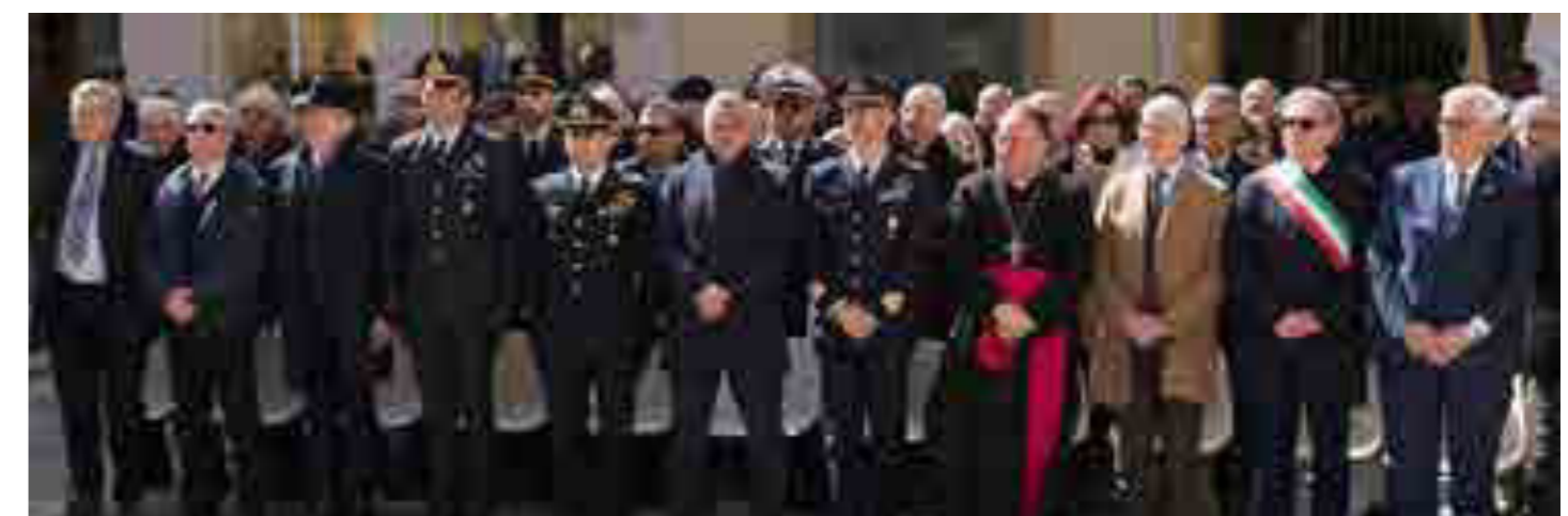
Donazione della stele per la pace