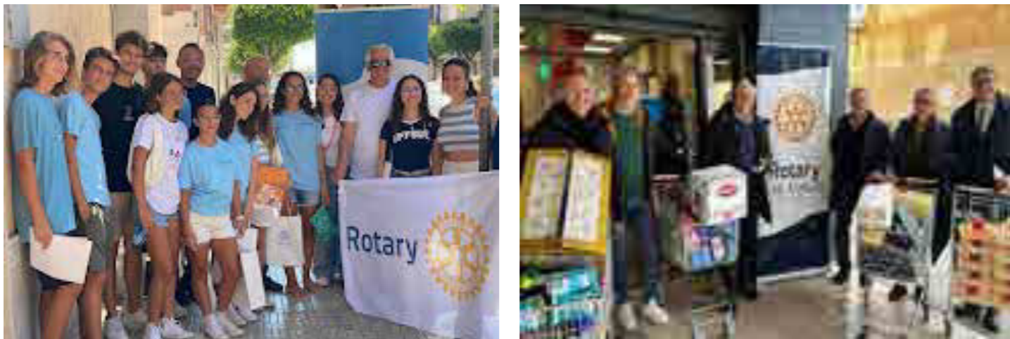
Foto di gruppo durante le raccolte di generi alimentari