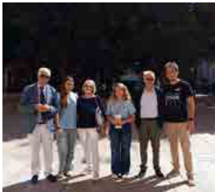
Il Rotary e l'Interact insieme ad accogliere i turisti visitatori