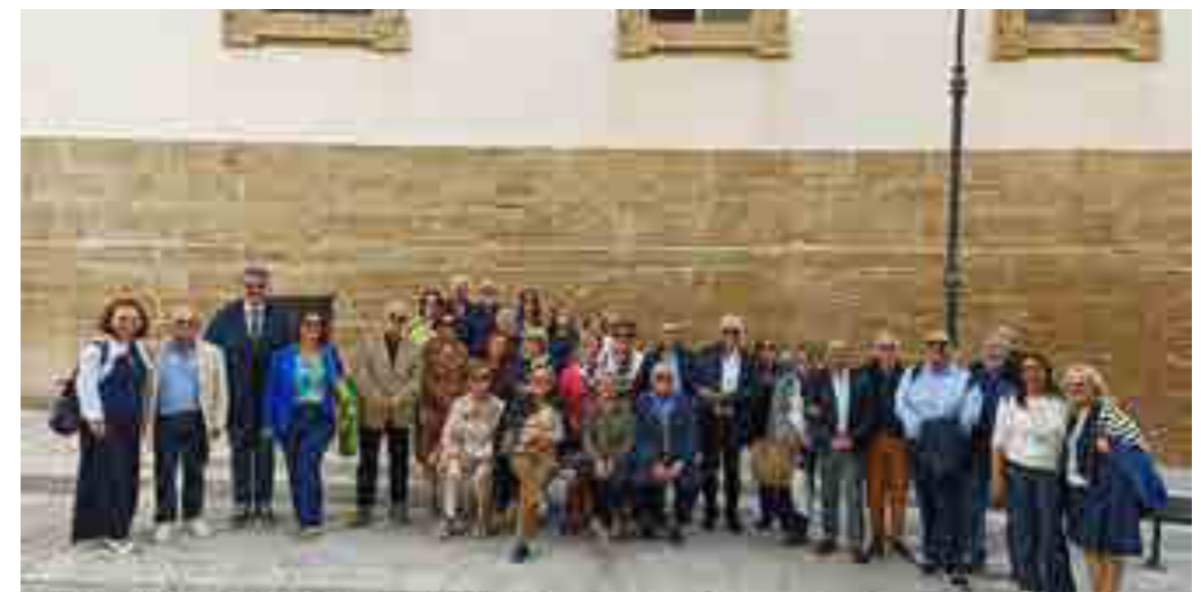
Sciacca - Interclub tra i Rotary Club di Sciacca, Marsala, Palermo Nord, Monreale e Termini Imerese