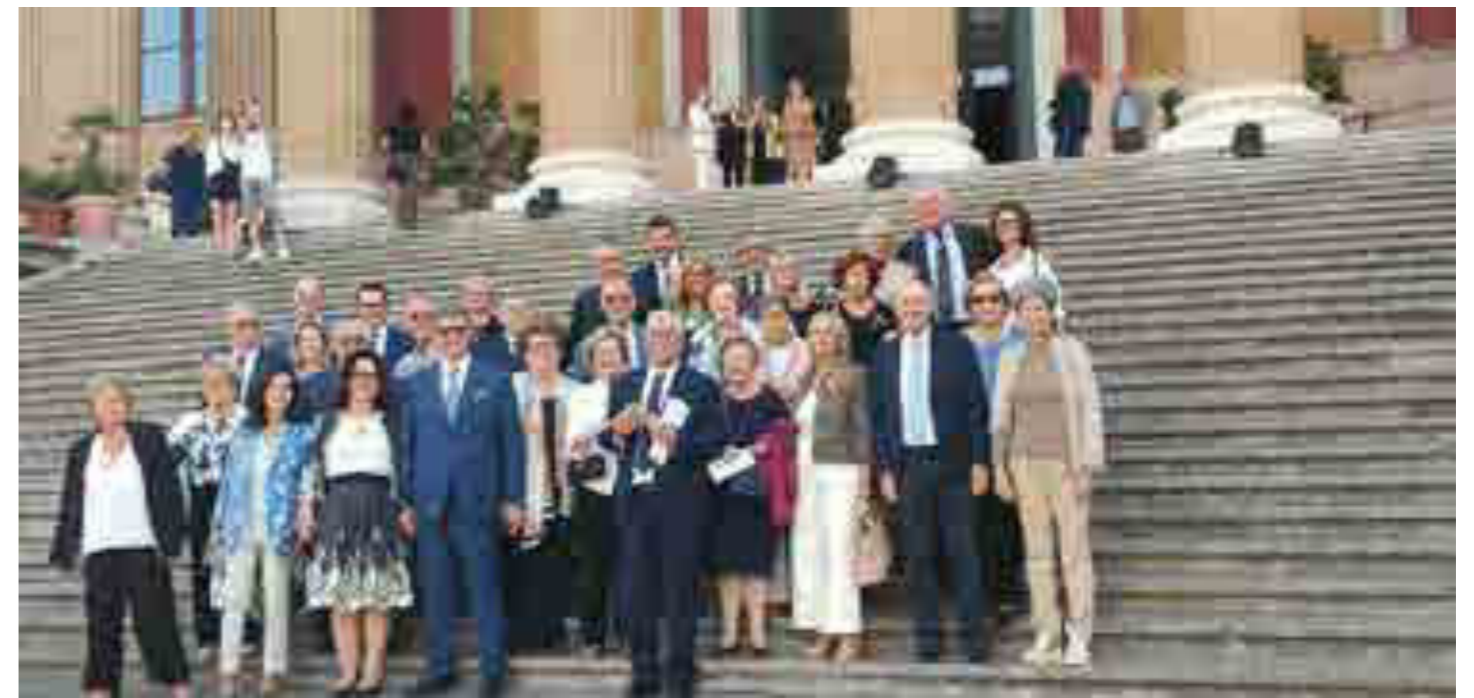
Teatro Massimo - Il Rotary unito nella cultura e nella condivisione

la visita a Guernica, luogo ricco di significato storico che ci ha profondamente toccati. A Guernica, abbiamo visto una riproduzione in ceramica del celebre dipinto di Pablo Picasso che oltre essere un manifesto contro gli orrori della guerra, è ancora oggi di grande attualità ed è considerata un'icona del dolore.