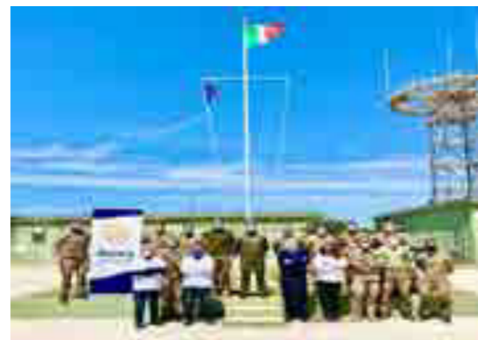
Corso BLSO presso la 135° Squadriglia Radar di Marsala