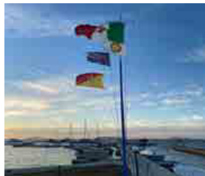
Momenti della giornata della "Vela senza Esclusi"

La collaborazione con la Croce Rossa Italiana, continuò anche per l'anno 20/21 e ci impegnammo nelle raccolte alimentari. In occasione dell'anniversario della fondazione del Rotary international, 23 febbraio, le nostre insegne furono esposte presso il comune di Marsala.