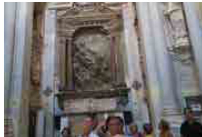
Le vie dei Tesori