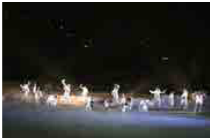
Teatro Greco di Segesta, "Sogno di una notte di mezz'estate"

Il BRIE si è concluso con l'incontro interreligioso dedicato alla promozione della Pace; durante tale incontro il nostro Governatore ha letto l'invocazione rotariana. Nel corso del BRIE, nella casa rotariana, il nostro Club ha esposto un roll-up con la promozione dei Progetti di Servizio ed ha proiettato, a ciclo continuo, un filmato esplicativo dell'Azione Rotariana.