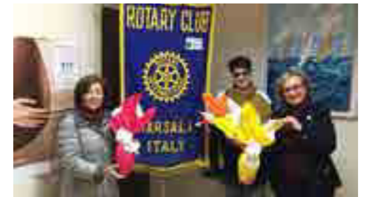
Consegna delle uova di Pasqua al Movimento per la vita di Marsala