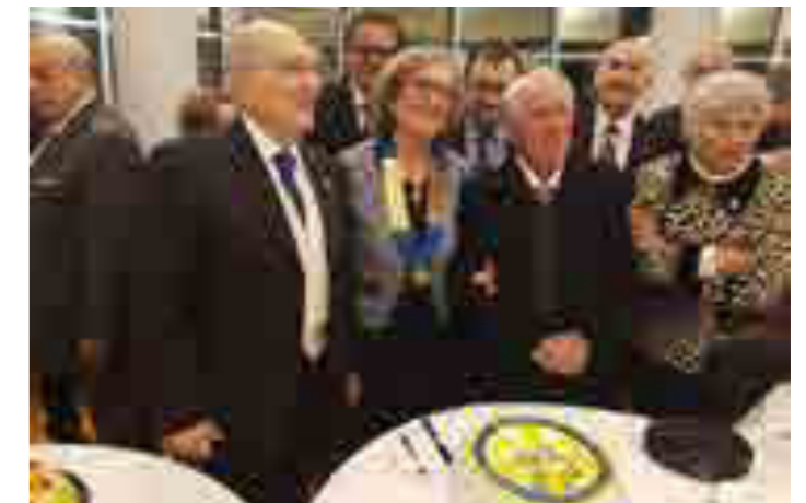
43° Anniversario del Club Marsala