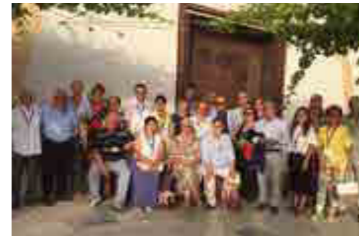
Alcamo, interclub Jelgava-Marsala