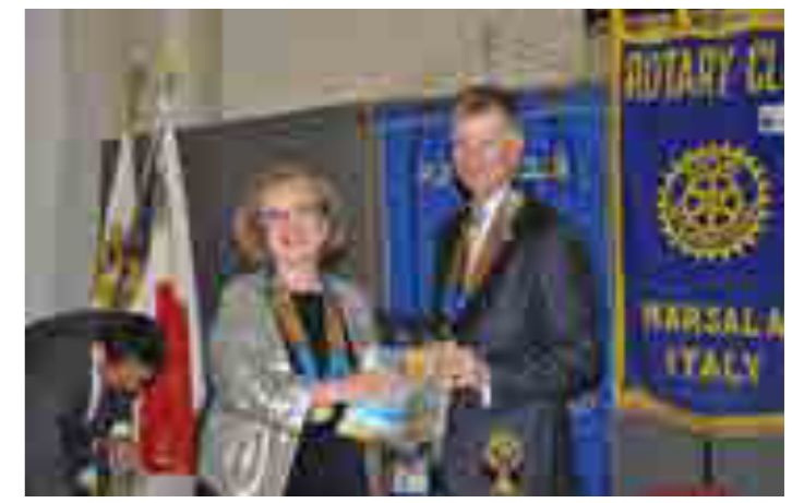
Visita del Governatore, scambio dei gagliardetti