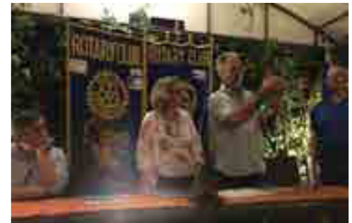
Alcamo, scambio gagliardetti