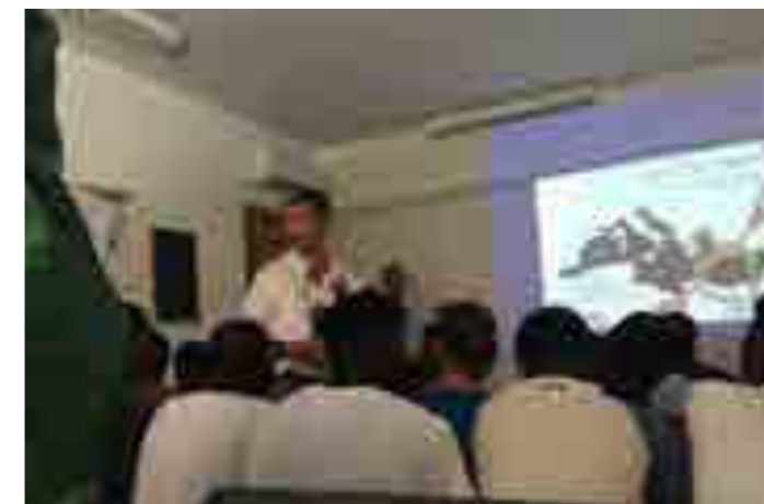
Centro Antares, progetto “Madri e figli migranti”