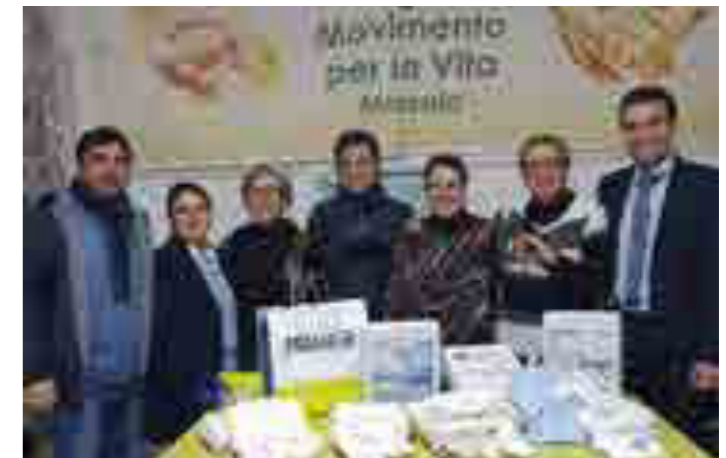
Natale solidale: donazione corredi per neonato