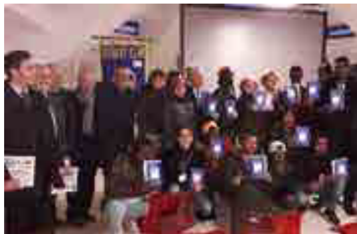
Progetto "Una luce per te", consegna dell'opuscolo trilingue