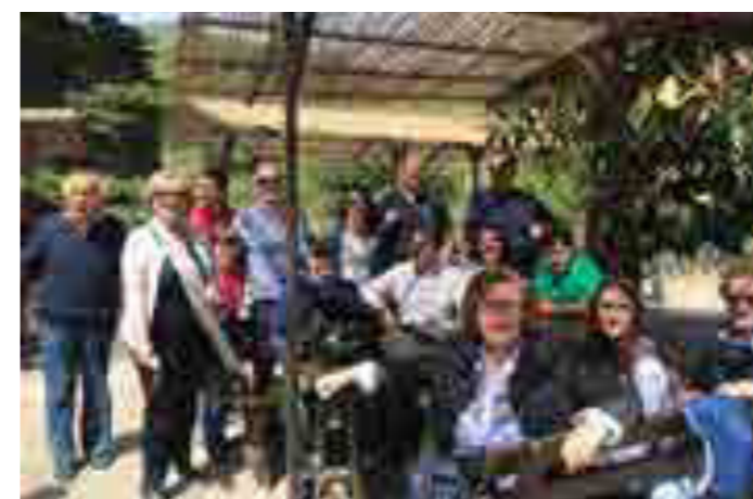
Segesta, primo maggio in amicizia