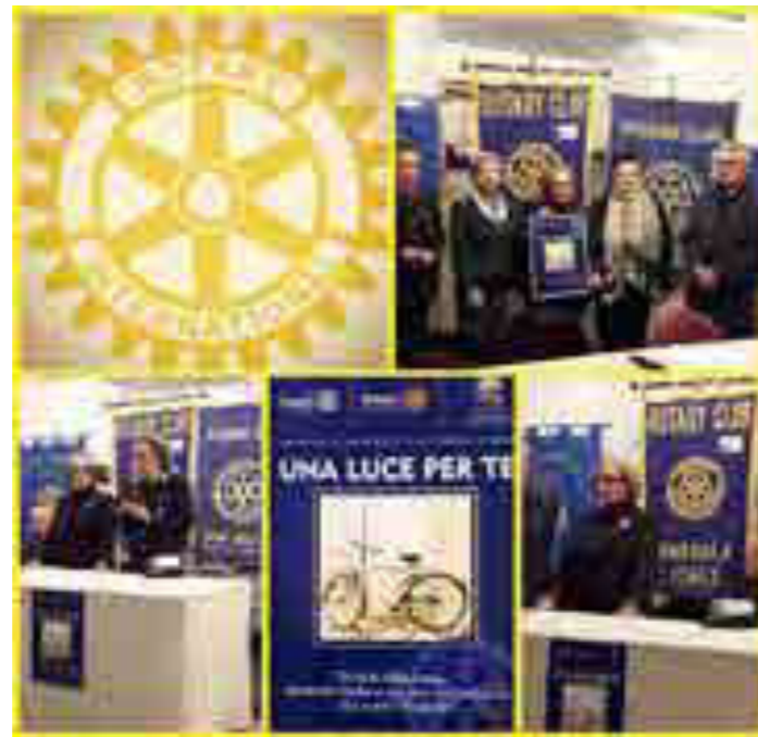
Progetto "Una luce per te"