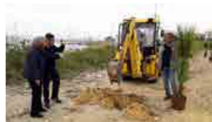
Progetto "Rotary Tree Planting"