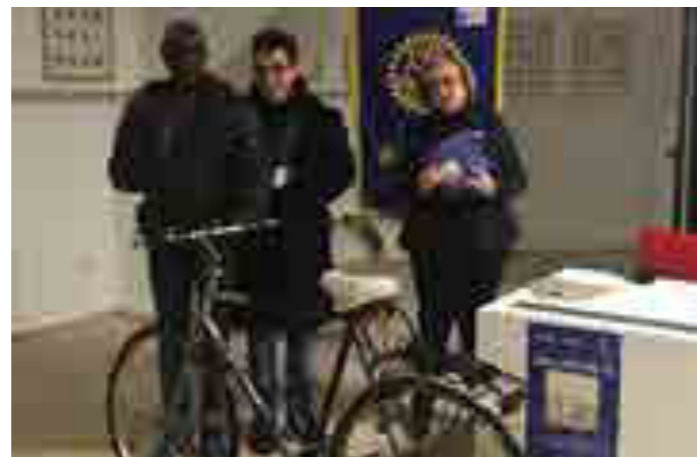
Progetto "Una luce per te", consegna bici