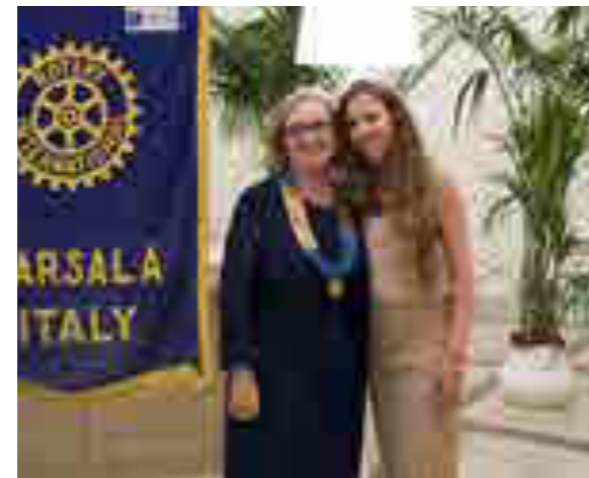
Passaggio della Campana