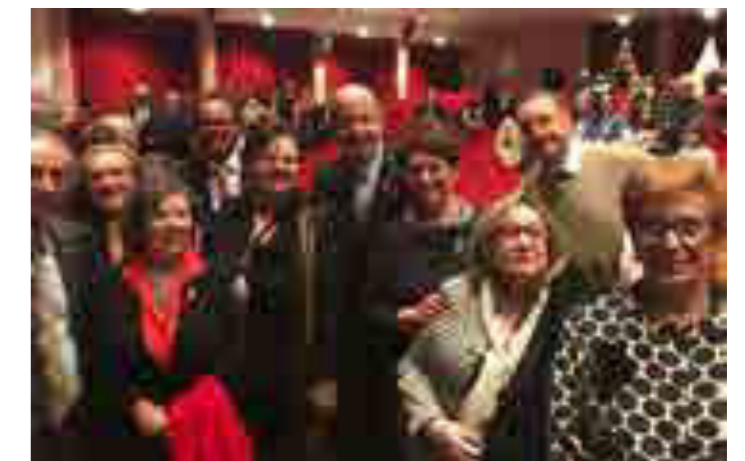
Foto di gruppo al concerto "Capitani coraggiosi" per End Polio Now