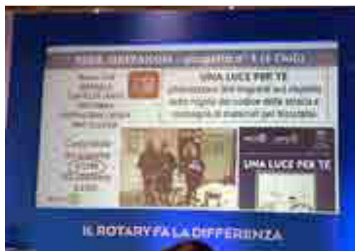
Malta, XL congresso distrettuale