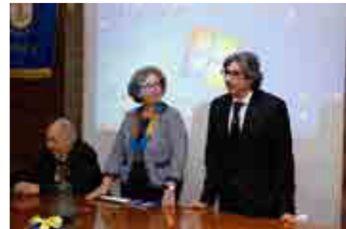
43° Anniversario del Club Marsala