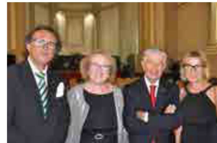
Visita del Governatore, foto di gruppo