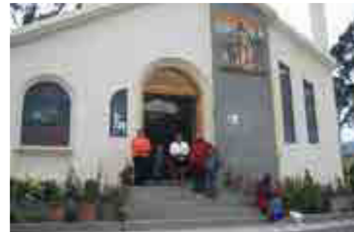
Natale solidale: progetto "Marsala-Ecuador... Ponte d'amore"

A conclusione del corso, che si è svolto da gennaio ad aprile 2018, 500 bici di ragazzi extracomunitari sono state dotate di dispositivi di illuminazione anteriore e posteriore, campanello, catarifrangenti per pedali.