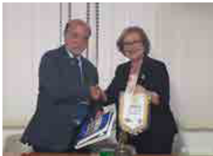
Incontro R.C. Marsala e R.C. Bologna Valle dell' Idice