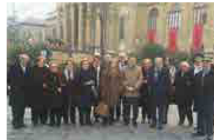
Il Rotary a Teatro