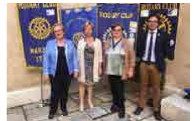
I presidenti che hanno condiviso il progetto "Espiazione dell'arte"