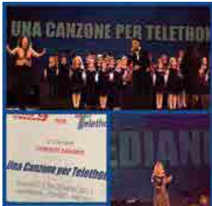
Una Canzone per Telethon