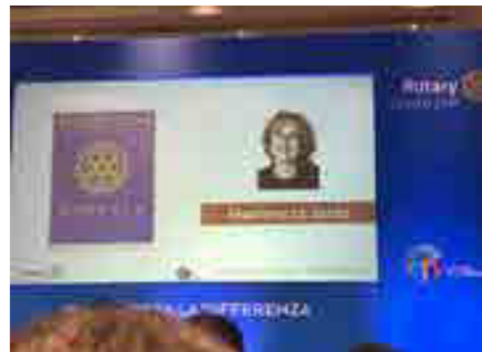
Malta, XL congresso distrettuale