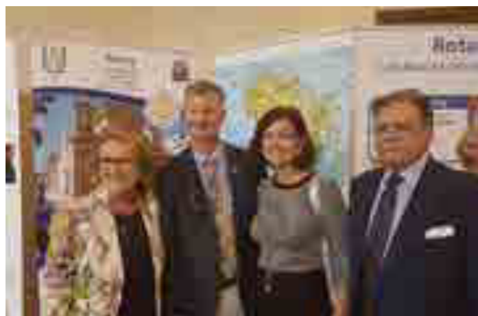
II edizione del BRIE