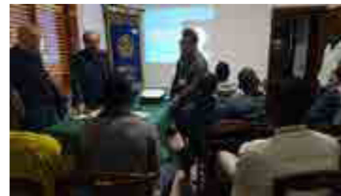
Conclusione progetto "Madri e figli migranti"