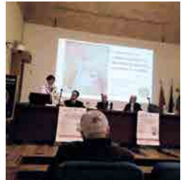
Incontro con il prof. Corsello sul tema delle vaccinazioni