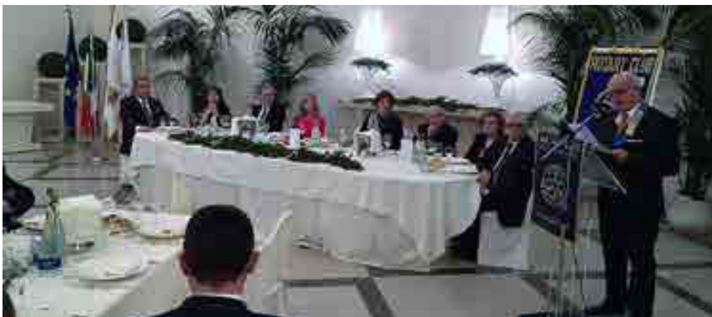
Festa degli auguri