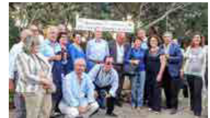
Mozia, 100 anni della Rotary Foundation