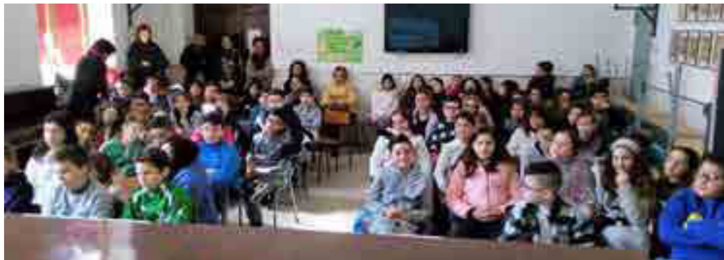
Progetto prevenzione obesità