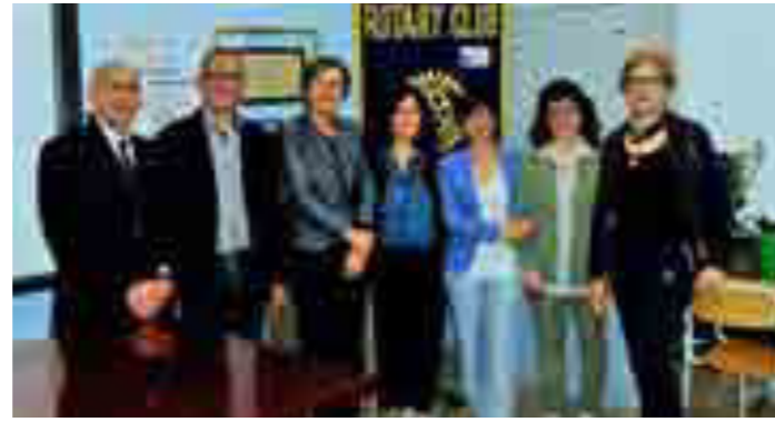
Progetto prevenzione obesità