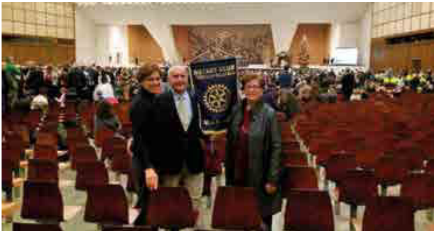
Udienza papale nella sala Nervi