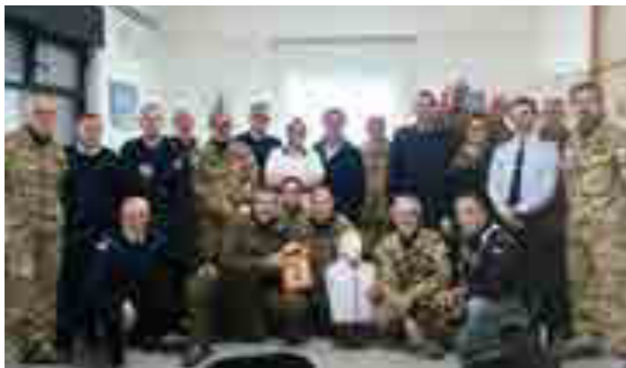
Corso BLS per aeronautica e Marina