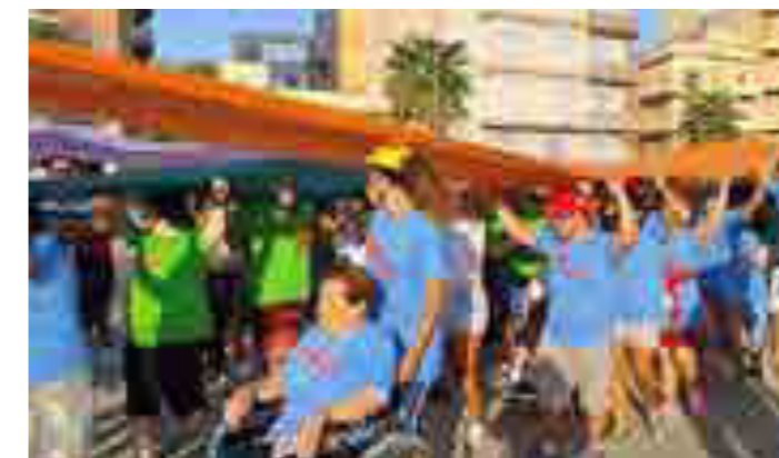
"Giochi senza barriere" per persone diversamente abili