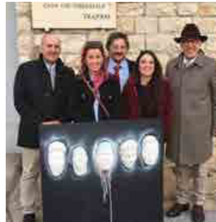
Progetto distrettuale "Espiazione dell'arte"