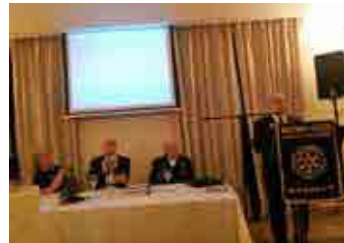
42° anniversario della fondazione del Rotary Club Marsala