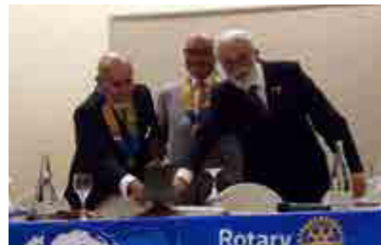
La visita del Governatore

Ad inizio anno, dal 19 al 24 luglio, siamo stati in Austria ed oltre ad apprezzare le bellezze di Salisburgo e Vienna, abbiamo assistito ad un concerto di musica classica nella Sala d'Oro del Teatro di Vienna ed abbiamo avuto un incontro col direttivo del Rotary Club di Wien-Graben.