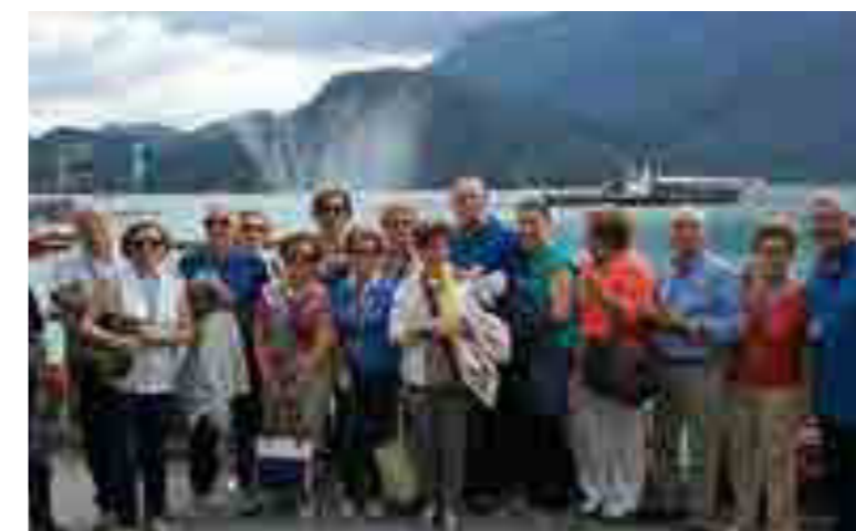
Gita a Salisburgo e Vienna

Nei mesi di dicembre e gennaio sono state organizzate diverse manifestazioni di solidarietà per i meno fortunati: Il concerto "Note di speranza" all'Auditorium Santa Cecilia che ha permesso di raccogliere fondi per il "Movimento per la vita" di