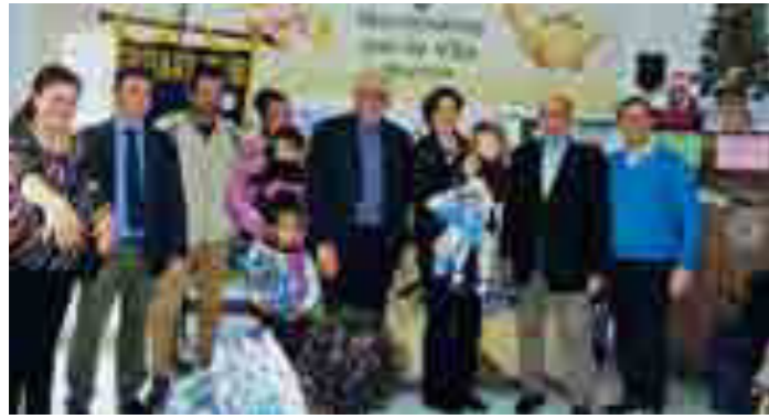
Donazione buoni pasto al "Movimento per la vita"

2-3 e 4 giugno: Sicilia Orientale, con tappe al teatro greco di Siracusa e a quello di Taormina.