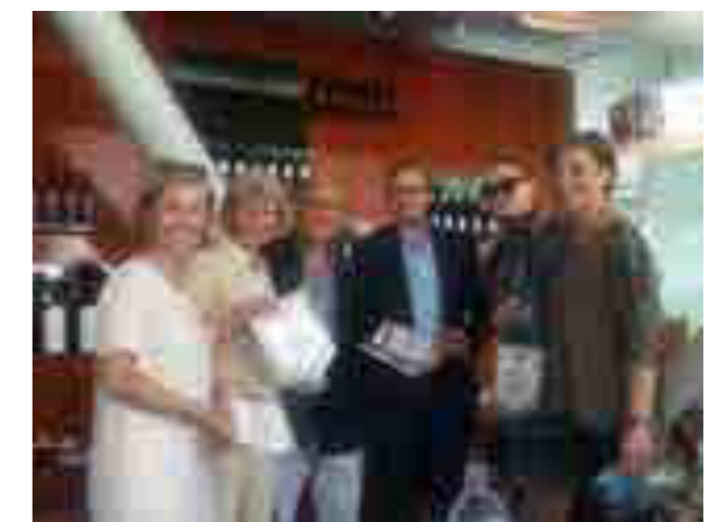
Incontro col direttivo R.C. Wien-Graben