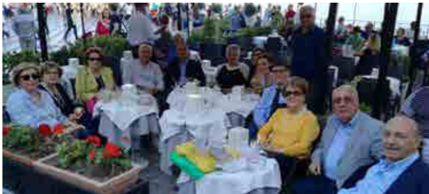
Tour Sicilia orientale