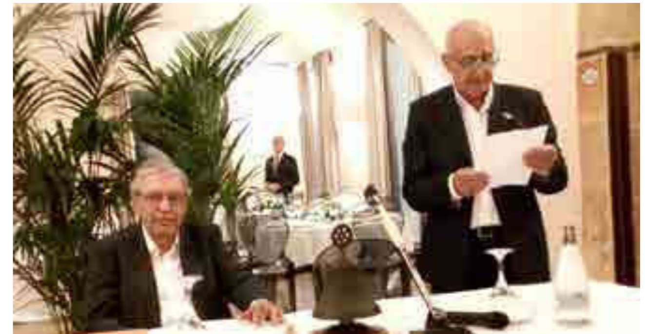
Convegno "Islam in Sicilia"